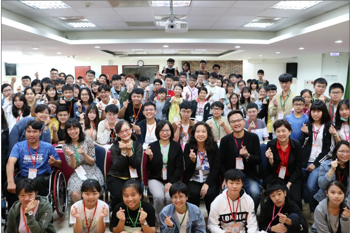
中央兒少代表下半年培力活動，現任（試行屆）與第1屆兒少共同參與，為參與政府議事了解相關資訊。（109年9月28日拍攝；地點：天下一家社教服務中心）