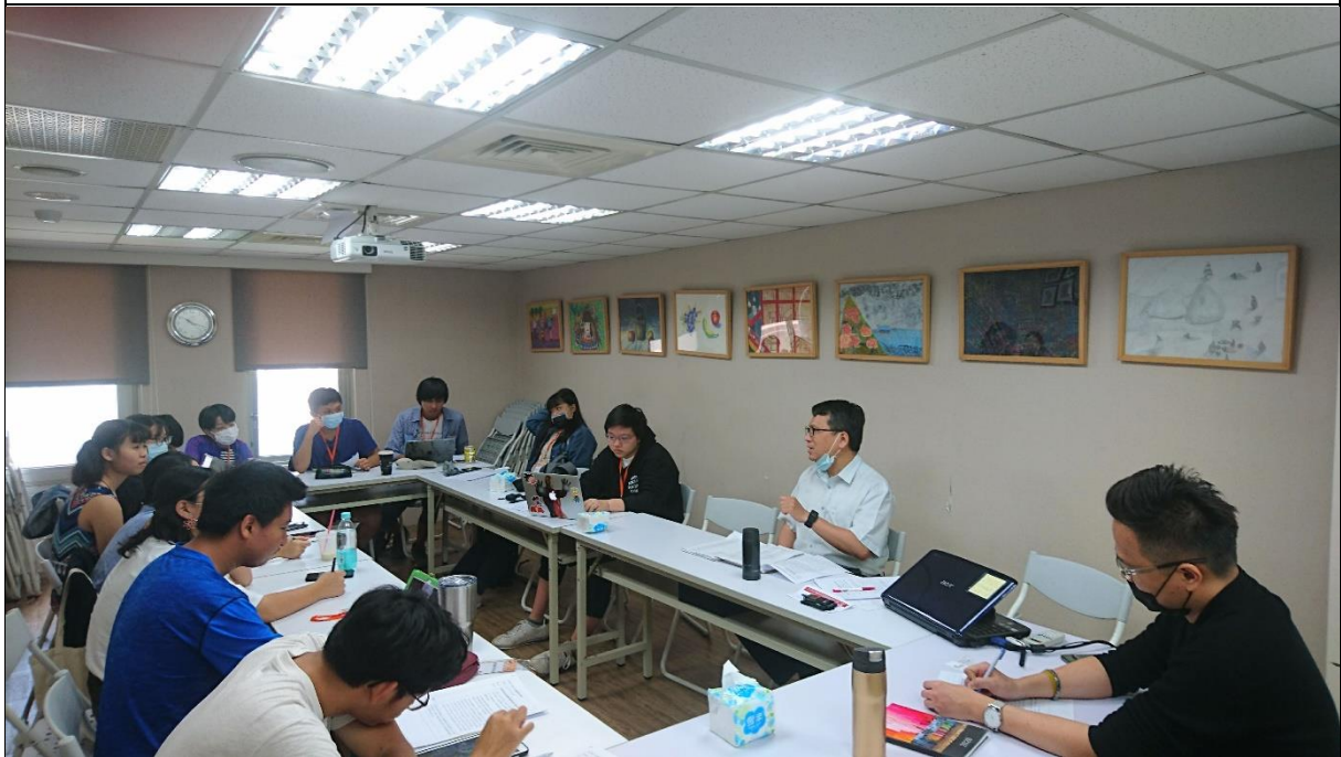
兒少代表為研擬「保護兒少免於新興菸品危害」提案，諮詢衛生福利部國民健康署、