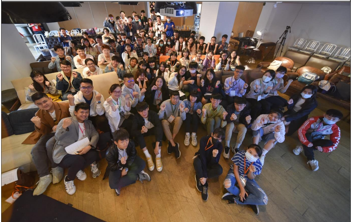
中央兒少代表期末團會議，現任（試行屆）與第1屆兒少共同參與，表達對兒少權益