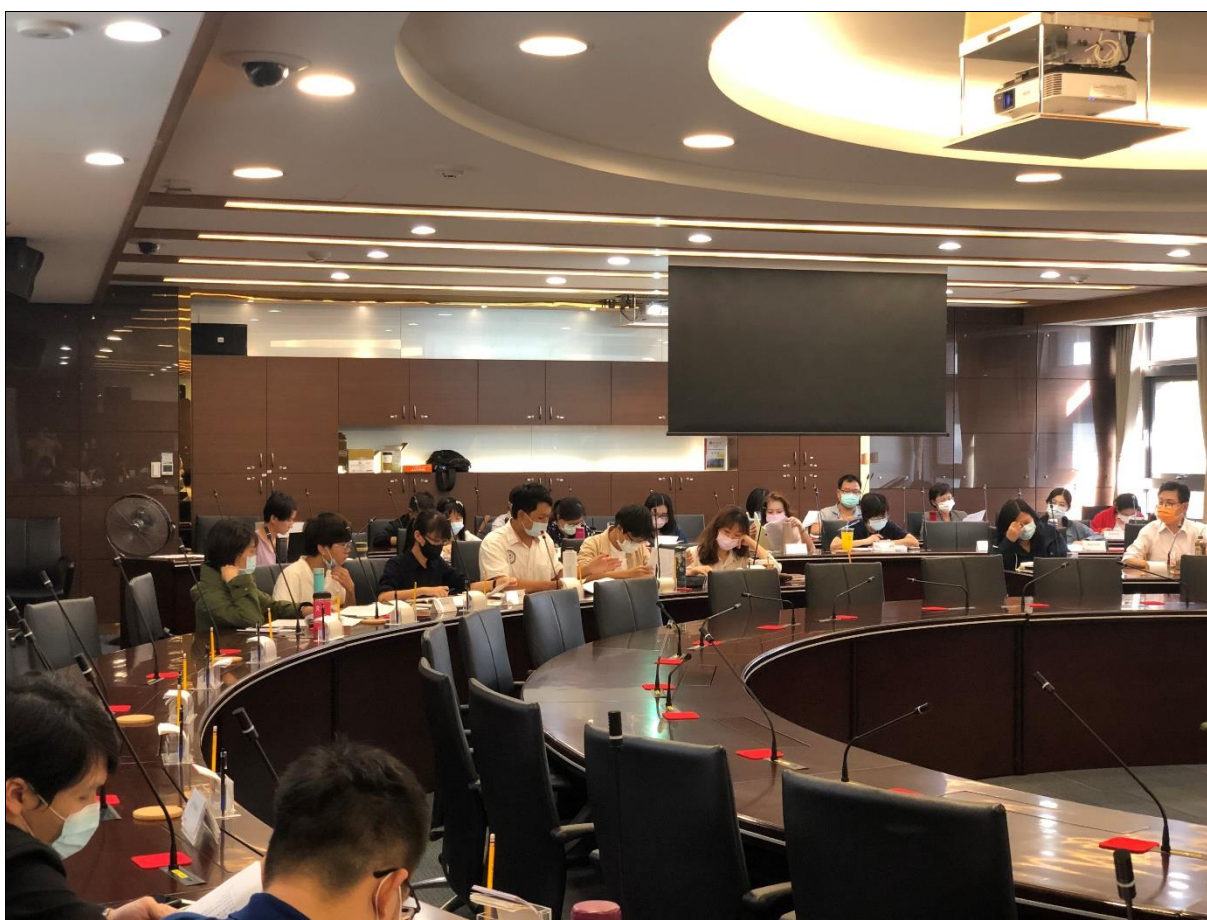
兒少代表宗婕妤、詹譽翔、鄒新猷、黃靜盈、許子安出席衛生福利部兒童及少年福利與權益推動小組 109 年第 2 次會議（109 年 11 月 2 日拍攝；地點：衛生福利部）

在行政院與衛福部的兒童及少年福利與權益推動小組、事故傷害防制推動小組會議中，兒少代表就其關注議題表達意見，獲得各部會正向回應與納入研議，近半年重點推動工作包含：關於安置機構評鑑指標之研修納入兒少代表參與、盤點兒少休閒場館情形並納入兒少意見修正社會福利「兒少文化及休閒娛樂」考核指標、強化校園心理輔導機制、新興菸品稽查人力分配及防制宣導等兒少代表建議皆受到正向肯定與支持，充分展現兒少代表的價值。