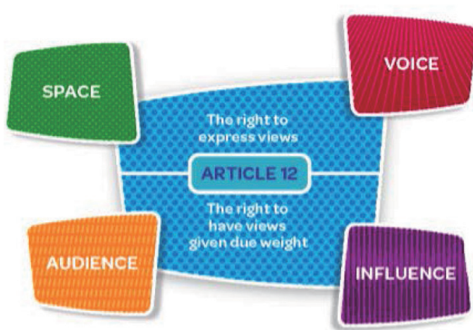
圖 Lundy's Model of participation( 引自 Department of Children and Youth Affairs (2015))